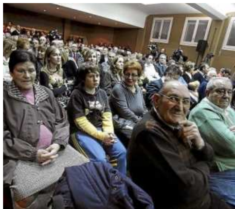
Vecinos de Ontiñena acudieron a la presentación del proyecto, en la que se habló de trabajo. R. GOBANTES